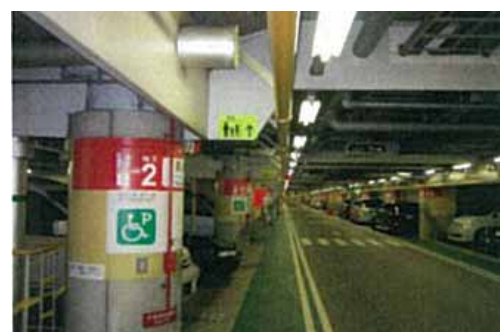
「サービスの充実:サインの設置」 賑やかさが必要、合流地点は特に留意