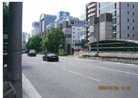
営業活動:案内看板設置