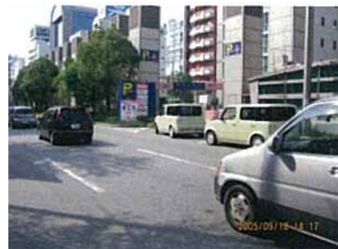
営業活動:案内看板設置・更新