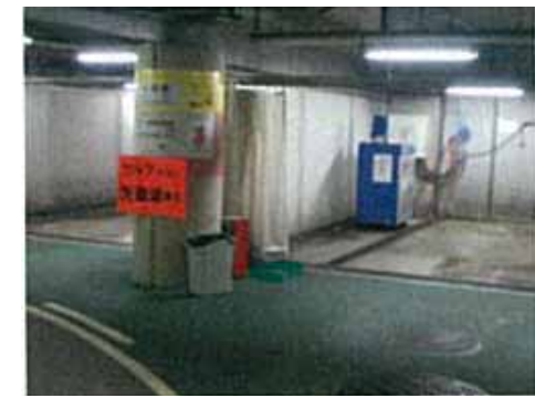
「サービスの向上:無料洗車場」