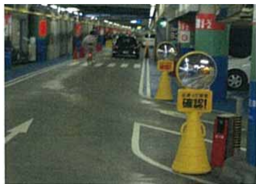
「安全確保:ミラーの設置・場内巡回」