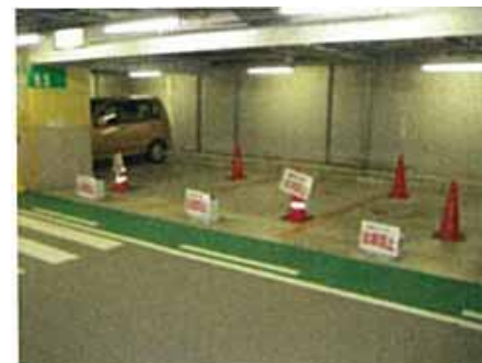
「サービスの充実:トラブル・クレームの即時解決」