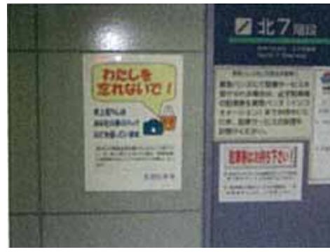
「サービスの充実:トラブル・クレームの即時解決」